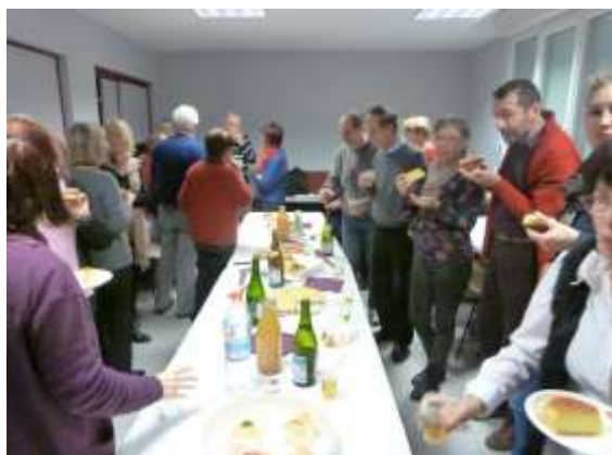
Galette des Rois Livre et Culture