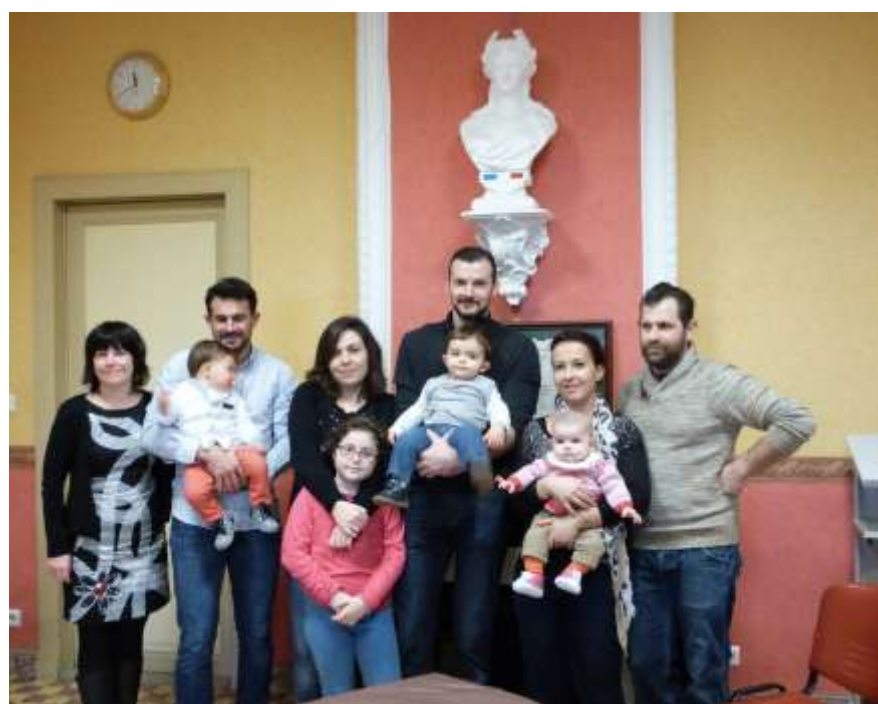
Arbre de vie