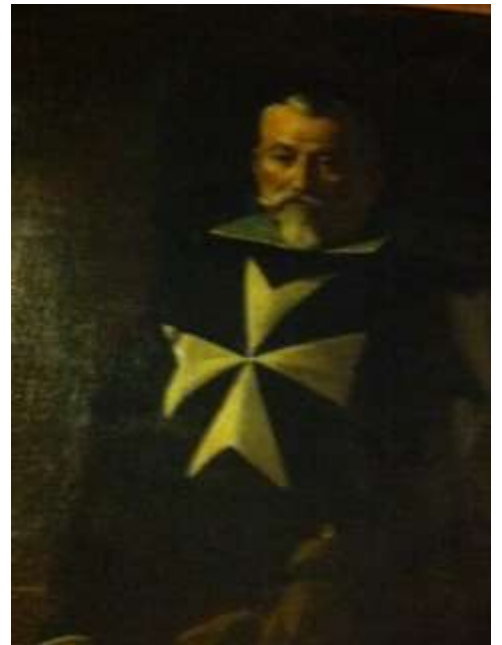
Grand Maître Ordre de Malte

Les chapelains et vicaires étaient rémunérés par l'ordre ils percevaient la (congrue maltaise) (1) correspondant aux deux tiers de la portion congrue reçue par le clergé ne relevant que de l'évêque.