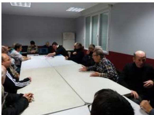
Assemblée générale Pétanque