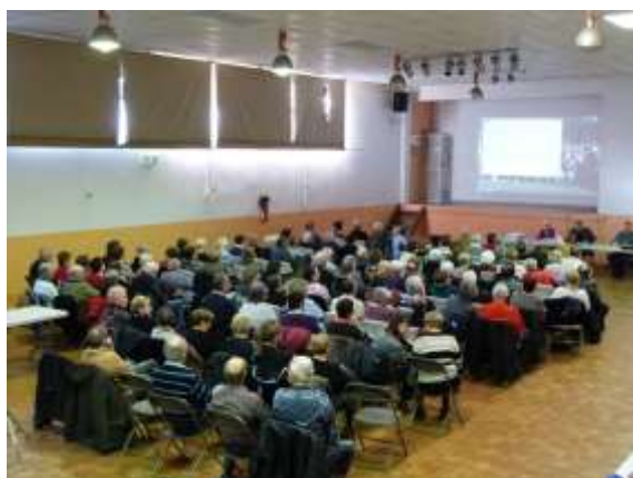
Assemblée générale Loisirs Séniors