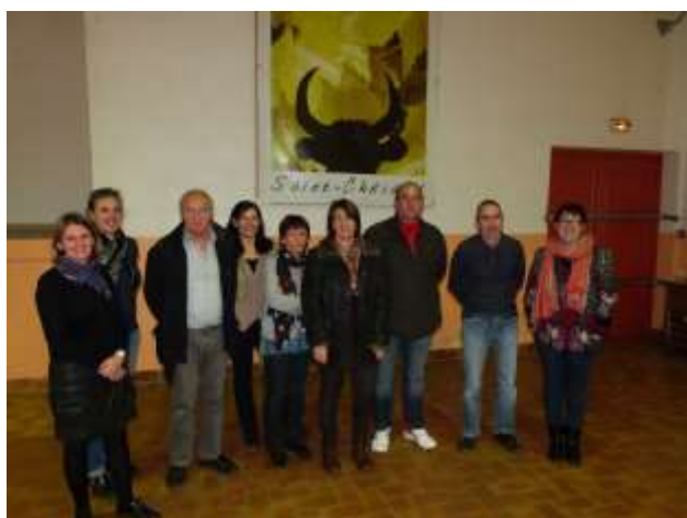
Assemblée générale comité de jumelage