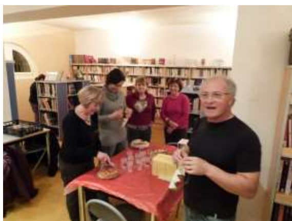
Galette à Bibliothèque